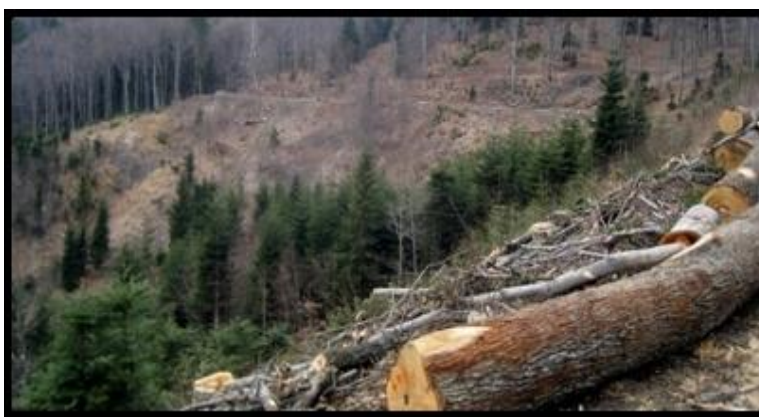
Šume nestaju sječom drveća i u požarima koji najčešće nastaju zbog ljudske nepažnje i nemara.

Šumama je pokriveno 31% ukupne površine zemlje, 36 % od toga čine prašume i u njima se održava 80% biološke raznolikosti. One nam pružaju hranu, gorivo, lijekove, energiju, pa i zaradu. I najvažnije od svega, daju nam zrak koji udišemo. Upravo stoga, Forum za šume Ujedinjenih naroda (UNFF) na svom 9. zasjedanju u New Yorku, 2011. godinu proglasio je Međunarodnom godinom šuma.