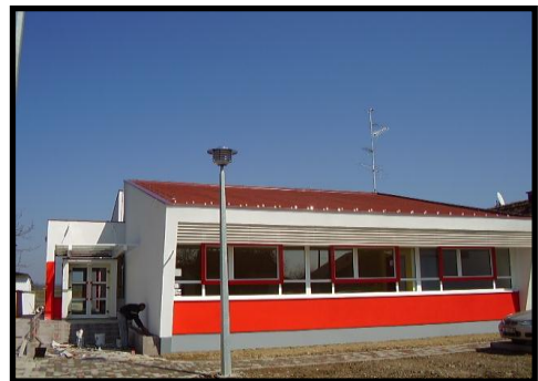
Područna škola u Donjoj Vrbi

Pretrpjevši dva rata, veliki potres, nagrizana zubom vremena, najstarija brodska osnovna škola postala je neprimjerena za nastavni rad. Uz pomoć Ministarstva prosvjete RH, Brodsko - posavske županije i grada Slavonskog Broda, 2006. škola je obnovljena te joj je vraćen dio duga za sve ono što je učinila za razvoj broskog školstva i kulture.