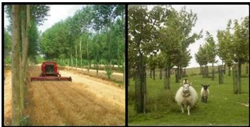
Jedna od glavnih tema u Međunarodnoj godini šuma je agrošumarstvo, odnosno sadnja drveća na poljoprivrednim zemljištima i objedinjavanje uzgoja usjeva, stoke i drveća.

Ovu je inicijativu pokrenula baš Hrvatska i to još 2005. godine nastojeći tom gestom ukazati na visoku